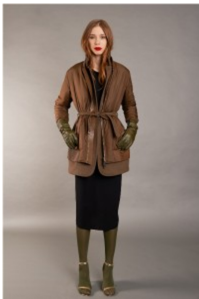
Larusmiani A/I 2016-17

New York, una mattina come tante una giovane donna apre gli occhi al mondo, si stiracchia, un rapido passaggio sotto la doccia, make-up, acqua di colonia, caffè, uno sguardo alle notizie del giorno e poi via con passo deciso a scandire le ore dei vari impegni di lavoro.