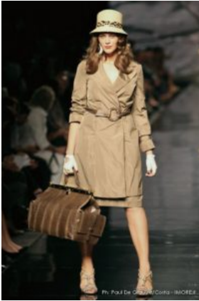
Elena Mirò P/E '10

Migliora, ma ancora non convince del tutto, la collezione Elena Mirò dedicata alle taglie morbide, con la quale si apre la prima giornata delle sfilate milanesi. Una lettera del Presidente Mario Boselli accompagna le notizie stilistiche sulla collezione. Vuole ricordare l'impegno che il mondo della moda si è assunto nel dicembre del 2006 con la sottoscrizione del Manifesto Nazionale di Autoregolamentazione della Moda Italiana contro l'anoressia. Con l'augurio di diffondere un modello sano e positivo di bellezza, la Camera si assume il compito di sensibilizzare gli operatori del sistema moda invitandoli ad accogliere un modello di bellezza vicino allo stile di vita del nostro Paese, i cui canoni hanno contribuito a diffondere la moda italiana nel mondo.