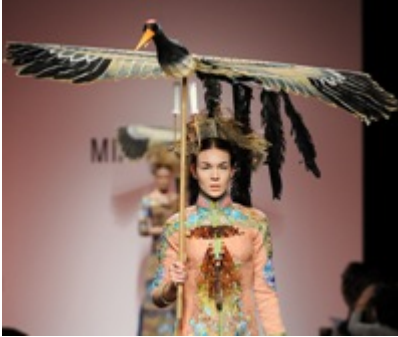
Minh Hanh

Gli accessori sono realizzati in osso, come i monili per i capelli, grandi pettini, fissati su acconciature orientate verso l'alto, ispirati ai gioielli indossati dalle antiche imperatrici vietnamite.