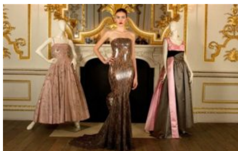
"Ballgowns: British Glamour Since 1950"