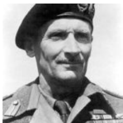
Bernard Law Montgomery

Alamari di corno a forma di olivetta infilati in occhielli fatti di un cappio di corda o pelle, tessuto caldo, cappuccio, sprone e tasche applicate fanno del montgomery uno di quei capi che non dovrebbero mai mancare nel proprio guardaroba.