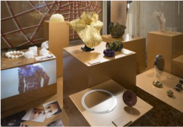
Museo del Gioiello di Vicenza Sala Futuro

Il 24 Dicembre, nell'imminenza dell'edizione invernale della fiera orafa di Vicenza, si è inaugurato nel cuore della città veneta il primo Museo del Gioiello , dislocato su oltre 450 metri quadrati della quattrocentesca Basilica Palladiana. Nato per iniziativa della Fiera di Vicenza con l'intento di assurgere a luogo emblematico della cultura italiana, in cui business, moda e sapere si incontrano idealmente, il nuovo museo "rappresenta un unicum nel nostro Paese" uno dei pochi al mondo dedicato esclusivamente all'arte orafa e gioielliera. "È stato pensato come uno spazio dinamico e innovativo, rivolto tanto agli esperti quanto alle nuove generazioni" ha spiegato Matteo Marzotto, Presidente della Fiera di Vicenza .