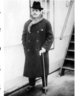
Sergej Djaghilev

Innanzitutto, Sergej Djaghilev (1872-1929), l'impresario russo che da Parigi, a partire dagli anni '10, consacrò gli spettacoli di balletti come l'evento teatrale più importante del primo quarto del Novecento, destinato a trionfare ovunque. Gli elementi della compagnia, del resto, erano i migliori sulla scena, provenendo quasi tutti dal grande Teatro Marijnskij di Pietroburgo (Pavlova, Karsavina, Smirnova, Nijinskij, Bolm, ecc.). Dotato di un carattere piuttosto autoritario e bisbetico, cultore ortodosso della danza classica, Djaghilev creò coreografie innovative in collaborazione con i massimi artisti contemporanei, dai pittori Picasso e De Chirico ai compositori Stravinskij e Debussy, solo per citarne alcuni, uscendo così dalle angustie del balletto accademico e sposando audacemente (diciamo pure scandalosamente, talvolta) temi moderni e stili d'avanguardia.