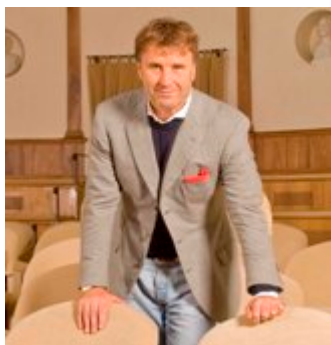
B. Cucinelli

Il nuovo progetto Laura Biagiotti Uomo, nasce dall'accordo di licenza con il Gruppo Nardelli che produce e distribuisce la collezione.