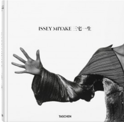
Issey Miyake cover di "Lyrical life-wear - The ultimate Issey Miyake"

Un duplice omaggio, con un libro e una mostra, al visionario stilista giapponese Issey Miyake , che negli anni '80 ha "silenziosamente" rivoluzionato la moda in nome della libertà di movimento, ovvero della grazia del corpo al naturale, concependo volumi androgini, iconoclasti delle forme tradizionali, evocativi di origami di carta pieghettata. Ha ideato così un nuovo genere di prêt-à-porter , che attinge a materiali e forme consoni al design industriale, ottenuti con processi produttivi all'avanguardia: carta metallica pressata a caldo, plissé , fili sintetici attorcigliati, jersey rinforzato, carta imbevuta d'olio. "La mia aspirazione é quella di andare avanti, di rompere gli schemi" era il suo motto.