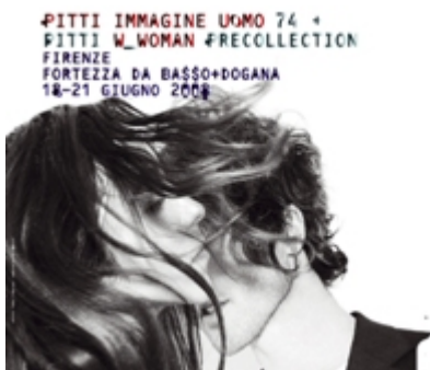
Edizione giugno 08

Giunto alla sua 75° edizione Pitti Immagine Uomo rivela anche quest'anno il suo prestigio attirando da tutto il mondo top buyer alla ricerca di marchi affermati e emergenti (845 i marchi disponibili) così come grandi aziende che colgono l'opportunità di presentare i loro nuovi progetti a livello internazionale. Completezza d'offerta, ottima tempistica e una cornice affascinante sono ancora una volta le chiavi del successo della manifestazione.