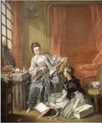
Francois Boucher - La sarta 1746

“Aveva cucito vesti / a donne e regine. / Decise infine / di rammendare /l’anima. / Buona vista, grande cuore / e mano delicata / per riannodare invisibili fili, / per riportare a tenuta / una stoffa lisa / e molto preziosa”. Questi versi bellissimi sono stati dedicati ad una sarta dalla sensibile poetessa parmigiana Ida Albianti.