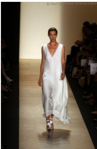
BCBGMAXAZRIA SS 2011

La collezione p/e 2011 firmata BCBG MAXAZRIA , brand ancora sconosciuto al mercato italiano, ma che vanta 653 negozi tra Spagna, Belgio, Francia, Grecia, Russia, Portogallo, Turchia, Inghilterra, Svizzera e Lussemburgo, suggerisce un look moderno, dalle linee fluide e leggere.