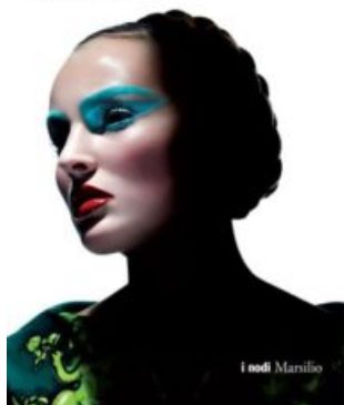
Cover di "Pitturare il Volto"