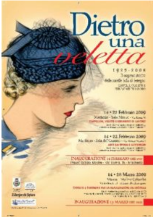
Locandina di una mostra

Dietro la veletta ogni sguardo aveva non uno, ma infiniti significati. Strumento raffinato di seduzione, quella lieve cortina di pizzo era in grado di rendere squisitamente audace qualunque donna la indossasse.