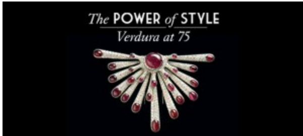
Locandina Mostra "The Power of Style: Verdura at 75"

La prima couturière a credere nel binomio moda-gioielli, ovvero a concepire i preziosi come accessori femminili ideali per completare lo stile, fu la divina Coco Chanel che infatti creò una pioneristica collezione di ornamenti preziosi da giorno e da sera, intercambiabili con la bigiotteria, affidando al duca siciliano Fulco di Verdura il compito di disegnarla. "Quali sono le donne che indossano meglio i gioielli?" fu chiesto un giorno all'aristocratico designer, cugino dell'autore del "Gattopardo" Giuseppe Tomasi di Lampedusa. Ed egli rispose: "Le donne alte e brune. Le altre fanno del loro meglio".