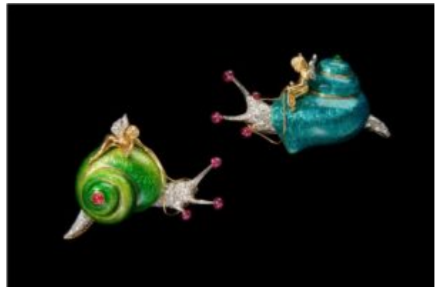
Fulco di Verdura spille con smalti diamanti rubini e smeraldi 1968

Per le sue creazioni preziose si ispirò spesso alle opere dell'arte barocca siciliana, alle tele del Tiepolo, alla vita fastosa della sua infanzia a Palermo, nonché al mondo marino. In effetti tra i suoi gioielli più famosi vi fu "il turbante Verdura", composto da una conchiglia naturale tempestata di peridot e turchesi. Celeberrimi furono anche i bracciali realizzati per Coco Chanel a cui si avvicinò negli anni Trenta ottenendo fama internazionale: si pensi agli impressionanti bracciali rigidi ricoperti di smalto bianco con croce di Malta in pietre di colore applicate sulla superficie. Dopo la guerra l'intraprendente designer si mise in proprio fondando l'omonimo brand di pezzi unici e aprendo a New York il negozio sulla Fifth Avenue che appunto quest'anno compie tre quarti di secolo.