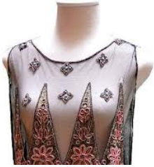
Amati e Ricamati