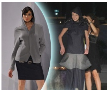
Vincitore Premio abbigliamento 2008