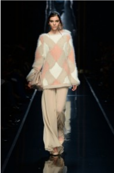
Ermanno Scervino A/I 2014-15