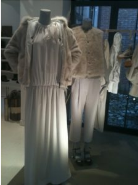
Cucinelli ph S. Bersani - Piccole intrusioni di colore