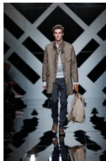
Burberry Prorsum p/e 10

reinterpretare continuamente il capo cult del marchio, adattissimo alla pioggia, ma capace di affrontare, se necessario, anche il sole anche se si tratta solo di un pallido sole inglese: il trench. Bisogna essere bravi per fare questo lavoro senza esasperare, nel nostro caso, gli “spettatori” riuniti in un caldo pomeriggio di giugno nella sala di Corso Venezia, ma anche per non stancare il mercato