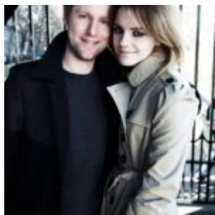
Christopher Bailey e Emma Watson

Al termine della sfilata saluta frettolosamente il pubblico, senza dare peso agli applausi. Eppure Christopher Bailey ha appena ricevuto, per il suo contributo al settore della moda, l' MBE cioè la nomina a Membro dell'Ordine dell'Impero Britannico (MBE) per il 2009 da parte di Sua Maesta' la Regina Elisabetta. Si prepara inoltre, con la collezione donna primavera estate 2010, all'impegno di chiudere la 25° edizione della London Fashion Week il prossimo 22 settembre.