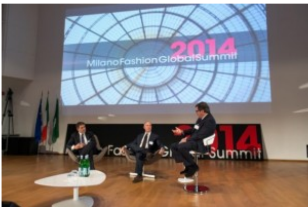
Milano Fashion Global Summit 2014