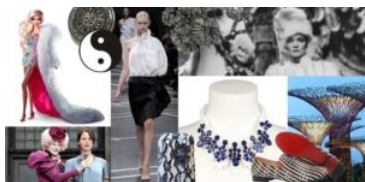
Contrasto courtesy WJA Italy

CONTRASTO - I materiali si fondono, si cercano privilegiando accostamenti originali ed innovativi, creano nuove sperimentazioni sfidando le regole. Positivo e negativo si compensano, maschile e femminile si mescolano, passato e futuro propongono insieme il nuovo percorso. Unioni che rafforzano le singole identità generando emozioni, reinterpretando la regola dei contrasti con coraggio ed efficacia. Riferimenti: Marlene Dietrich, Givenchy.