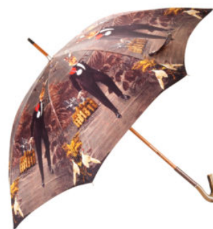
Capsule Collection di Leitmotiv for Furla Talent Hub

Ma l’iniziativa, che regala alla città una giornata così particolare, prevede un’altra sorpresa per i milanesi.