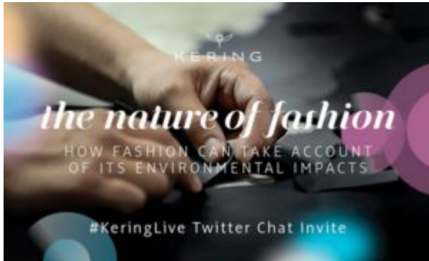
Kering-Invito su Twitter

Sostenibilità è diventata la nuova parola d’ordine del fashion system planetario. Ovunque se ne parla, ovunque la si studia, ovunque si sviluppano progetti per realizzarla. Niente meno che Kering , “gigante” del lusso mondiale con molteplici interessi nel campo della moda, in nome della sostenibilità ha addirittura rivoluzionato la sua comunicazione corporate. In effetti, dopo aver pubblicato un report sulla questione, per la prima volta ha utilizzato un social network - nello specifico Twitter - per inaugurare il nuovo corso con un inedito dibattito sulle tematiche ambientali. Si tratta di una modalità che presto potrebbe riconfigurare radicalmente la gestione delle informazioni e dei contatti con i clienti finali.