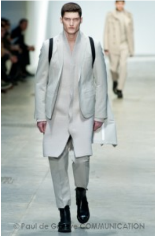
Costume National Home A/I 2012-13- Ph D. Munegato

Lanciato verso il futuro, un po' Star Treck, un po' uomo del proprio tempo che però vuol vivere con uno stile nuovo, moderno. Ed allora l'uomo di Ennio Capasa per Costume National inizia con voglia di rinnovare la propria immagine, attraverso un abbigliamento di rottura ma non sovversivo, originale ma non stravagante, talora divertente, ma non inverosimile; di sapore rock, ma con contaminazioni classiche. Lo stilista con grande capacità mixa per lui stili e soluzioni diverse; assembla capi tra loro distanti, li fa convivere in uno stesso outfit -il trench diventa dietro un bomber-; suggerisce modi nuovi di indossare capi -il cappotto è portato "appeso" alle spalle quasi si trattasse di un nuovo accessorio; abbina materiali tessuti, plastica e metallo; sorprende con i contrasti visivi come la giacca sartoriale che dietro è in maglia; le linee eleganti dei cappotti si mescolano con quelle sportive; un cardigan allungato, quasi un cappotto, accetta un giubbotto corto ed addirittura la giacca del completo.