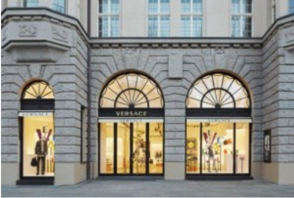
Facciata della boutique Versace a Berlino

Nel 2017 ricorreranno i 20 anni dall'improvvisa, tragica scomparsa di Gianni Versace (Reggio Calabria, 1946 - Miami Beach, 1997), il grande stilista italiano che - come affermò il suo amico Franco Zeffirelli - "ha liberato la moda dal conformismo, regalándole la fantasia e la creatività". Per ricordare questo anniversario si stanno già organizzando eventi in tutto il mondo, a cominciare da Berlino, dove nell'autunno scorso è stato offerto un hors d'oeuvres del fashion menu che poi verrà servito.