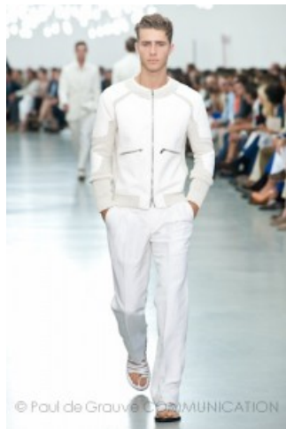
Corneliani PE 2103