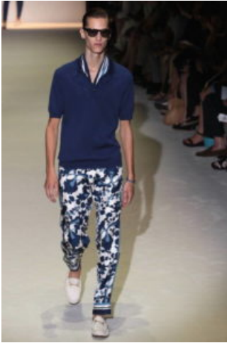
Gucci PE 2013