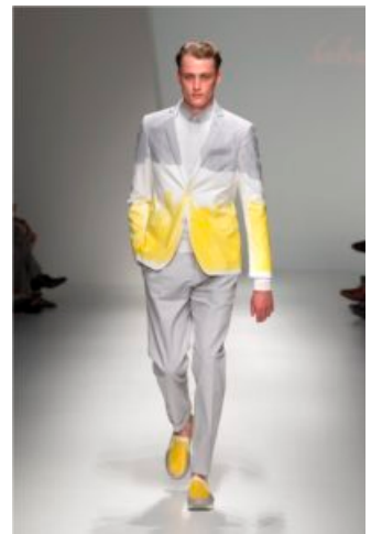
Ferragamo PE 2013