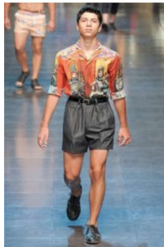
Dolce e Gabbana PE 2013