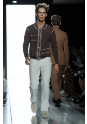
Bottega Veneta PE 2013