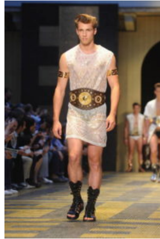
Versace PE 2013