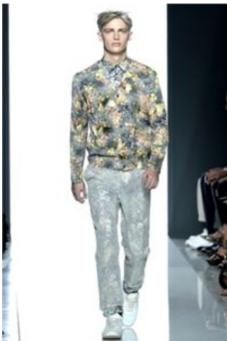
Bottega Veneta PE 2013