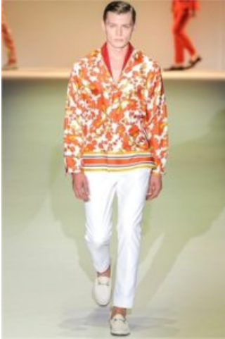
Gucci PE 2013

Voilà, puntuale (più o meno) come sempre, la primavera: i capi pesanti ancora una volta si accingono a far posto a quelli più freschi, le fragranze lievi e brillanti spazzano via quelle sontuose e calde, una nuova luce entra nel guardaroba e... l'uomo alla moda riparte "punto e a capo" (parola di Miuccia Prada), puntando tutto sulla raffinatezza sartoriale, non scevra tuttavia da una buona dose di sportiva (e talvolta bold ) praticità. Ecco dunque il maschio della primavera/estate 2013, forte ed elegante, acceso di bagliori mediterranei come un quadro di Guttuso e carico di accessori technicolor, un po' Italian gigolò , un po' dandy levantino, un po' caprese minimal e purista. Il fatto è che a dettar legge sempre più in materia di gusti è il codice estetico dell'Oriente, area geografica dove oggidi si macina la stragrande maggioranza degli utili e dove si continua a coltivare il mito alquanto stereotipato e sovente contraddittorio di un Belpaese che non c'è più: W Portofino, W il "gladiatore" cresciuto a pizza e caffè espresso, W la sofisticatezza artigianale, W i colori caldi dell'estate marina.