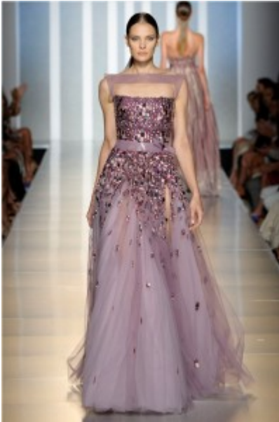
Tony Ward ph Luca Sorrentino courtesy Altaroma

L'alta moda di Tony Ward, per il prossimo autunno-inverno, pone al centro della ricerca creativa il colore. Il titolo della collezione "Nuances" evoca il passaggio graduale da una tonalità all'altra, il tocco leggero che ammalia l'occhio, in un divenire che si pone interrogativi di stile rispondendo in modo femminile e sensuale. Il colore dialoga con se stesso, fra continuità e desiderio di rottura, mimetizzandosi fino ad ottenere risultati particolarissimi nel gioco e nel contrasto tra toni più chiari e più scuri, accesi piuttosto che opachi. La centralità del concetto di sfumatura non si applica esclusivamente alla gamma cromatica che va dal blu notte all'argento, dal rosso all'oro, dal rosa al lilla, fino alla presenza immancabile del nero spesso accoppiati nella realizzazione di un'unica creazione, con modalità degradè. Le stesse linee degli abiti e dei tailleurs restituiscono un motivo a piccole pieghe, gli abiti corti e strutturati si ispirano alle forme artistiche di Renzo Piano e Santiago Calatrava, gli abiti lunghi propongono movimenti e volumi fluidi che accarezzano il corpo o moti avvolgenti e fascianti, come se si volesse "rappresentare" sulla passerella, le diverse fasi e i diversi momenti della seduzione. Va quindi in scena per AltaRoma, una danza fatta di varie lunghezze, intenzioni e gradazioni, che tiene conto delle esigenze del giorno ma soprattutto delle necessità imprescindibili della sera.