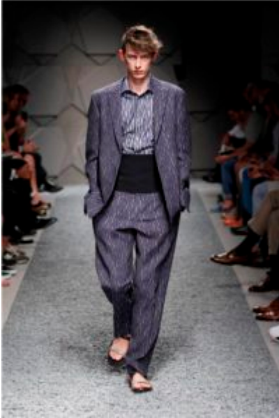
ZZegna P/E 2014

Paul Surridge ha disegnato con consapevole sfacciataggine una collezione dal mood rilassato pensata per giovani spiriti dinamici che vogliono vestire comodi, senza però rinunciare a tessuti preziosi e a tocchi di impeccabile sartorialità.